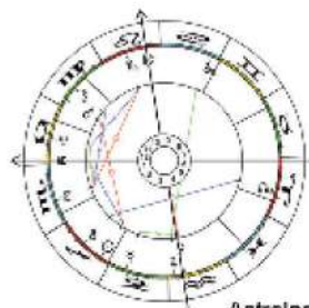
Astrologie: Horoskope Lieferung innerhalb 48 Stunden

Sexueller Missbrauch in einem katholischen Knabeninternat, zerstörte Biografien und gescheiterte Beziehungen, eine Sekte sowie zwei mysteriöse Todesfälle - das ist der Stoff, aus dem man Psychothriller macht. Susann Pásztor, MultiMind